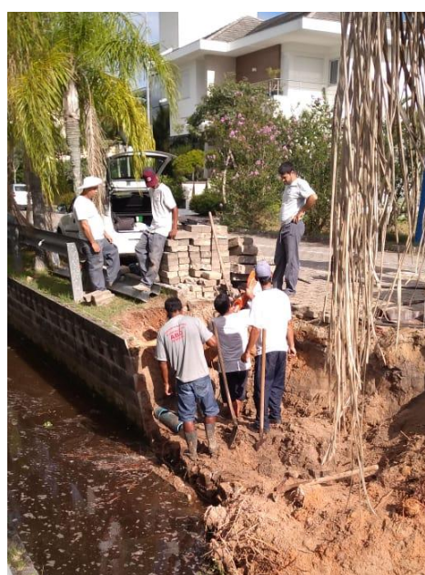
Foto 4 e 5 – Canal Avenida dos Dourados