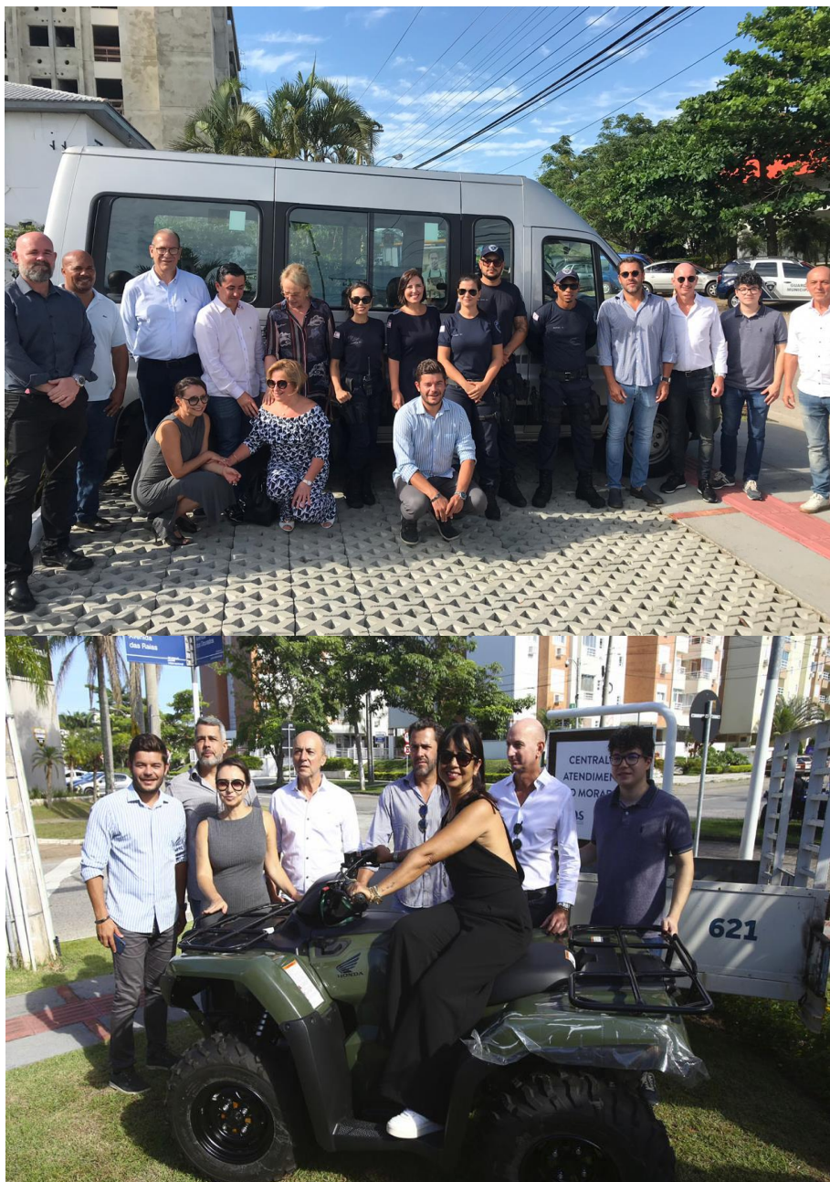
Foto 5 e 6 – Evento de entrega da van e quadriciclo para a Guarda Municipal e Comcap