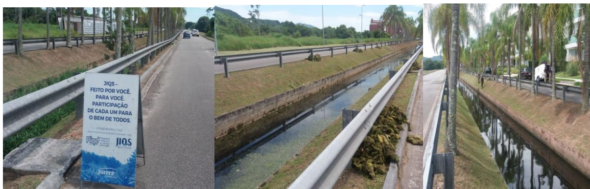
Foto1,2 e 3 (credito foto: Maurício Momm): Avenida das Lagostas

Foram realizadas as limpezas, com roçadas e retirada do lodo, dos Canais da Avenida dos Dourados, Avenida das Raias e Avenida das Lagostas. Este serviço é importante para a não proliferação de algas, assim como para desobstrução para a drenagem das águas de Jurerê Internacional.